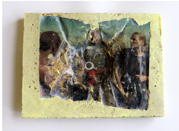
Paula Barth, Fotoübertragung auf Schwefelbeton photo transfer on sulphur concrete

Zu den druckgrafischen Techniken zählen unter anderem Radierung, Lithografie, Holzschnitt, Kupferstich sowie Offset- und Siebdruck.