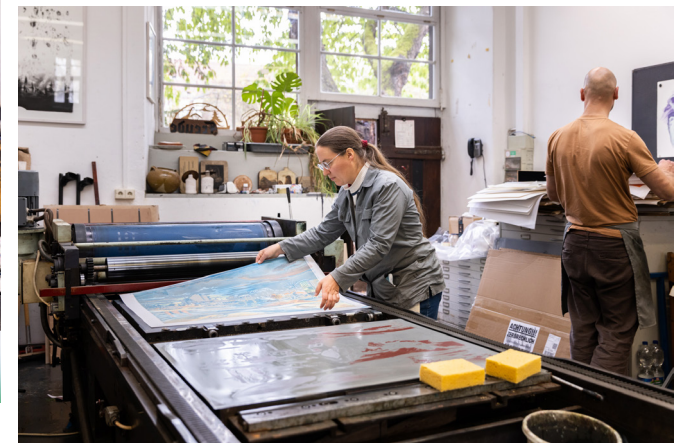
Druckwerkstatt Printing workshop