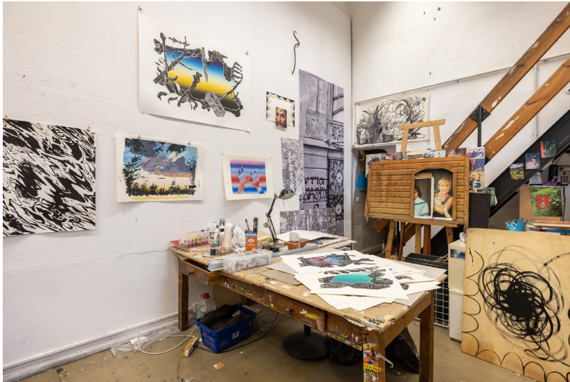
Zeichnungen und Druckgrafiken im Atelier Drawings and printed works at the studio