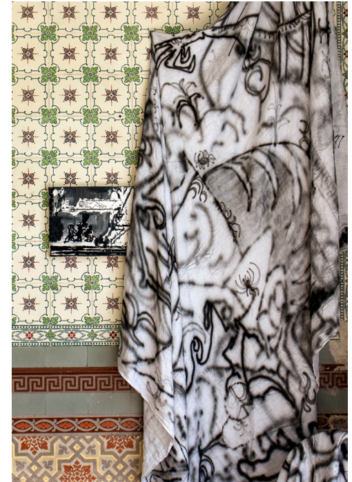
Giancarlo Carco David Gholipour Ghalandari, Tattoo-Tinte auf Bettlaken, Öl auf Leinwand tattoo ink on bed sheet, oil on canvas