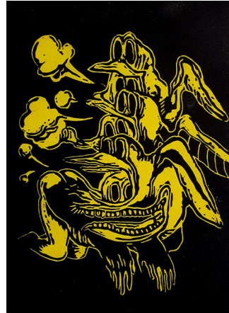
Soomee Yu, Linoldruck linoleum print

Zu den druckgrafischen Techniken zählen unter anderem Radierung, Lithografie, Holzschnitt, Kupferstich sowie Offset- und Siebdruck.